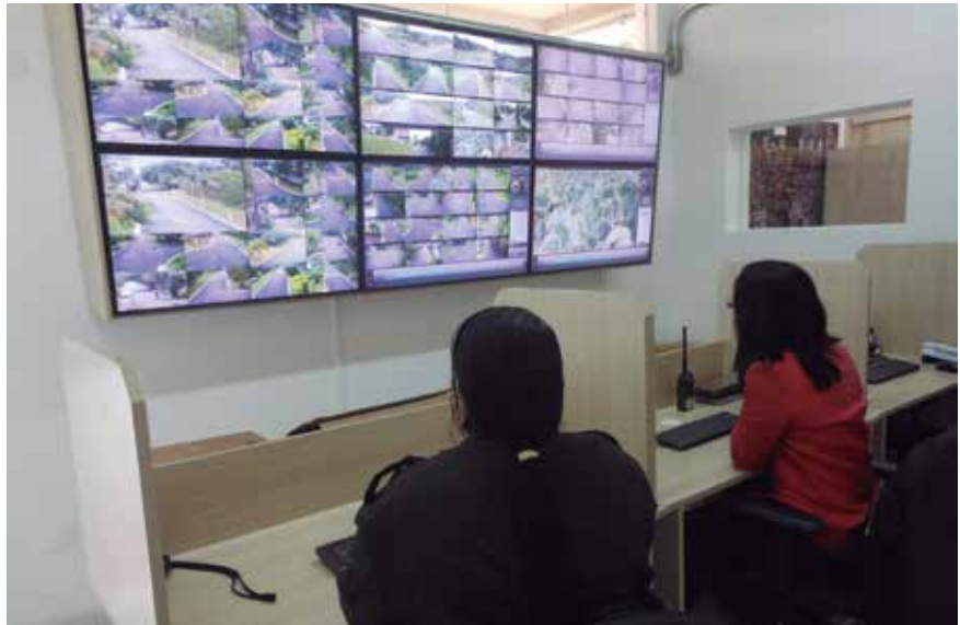
Sala de Monitoramento Eletrônico