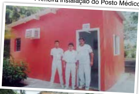
Primeira instalação do Posto Médico