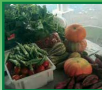
Produção da Horta

Na Horta Social são produzidos alimentos orgânicos, que são encaminhados preferencialmente para enriquecer a merenda das escolas do entorno do Loteamento. Desde 2011 foram produzidas cerca de 4 toneladas e mais de 1200 visitantes.