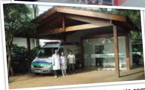
Atualmente, o Posto Médico conta com modernos equipamentos para urgências e unidade móvel UTI.

Desde o início de suas atividades, o Posto Médico mantido pela Administradora Jardim Acapulco tem aprimorado suas atividades com melhorias no espaço físico, novos equipamentos e qualificação da equipe. A foto da matéria ilustra a primeira instalação do Posto Médico. Hoje, o serviço conta com a unidade móvel UTI para primeiros socorros, em casos de emergência, além de médico e enfermeiro para melhor atender aos proprietários, colaboradores, familiares ou convidados que estejam nas dependências do Jardim Acapulco.