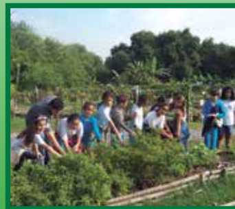
Alunos durante visita