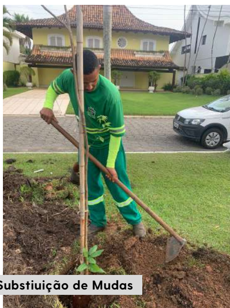
Substituição de Mudas