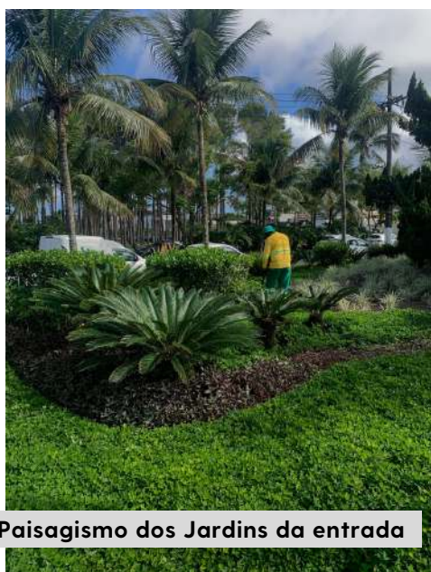
Paisagismo dos Jardins da entrada

Reposição de espécies arbóreas mudas mortas: 305