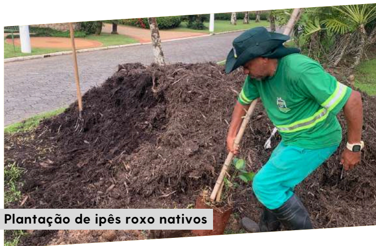
Plantação de ipês roxo nativos

A Gerência de Meio Ambiente colocou em ação o Projeto de Enriquecimento Ambiental e Paisagístico: