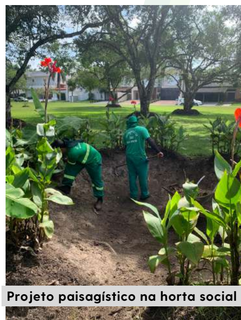
Projeto paisagístico na horta social