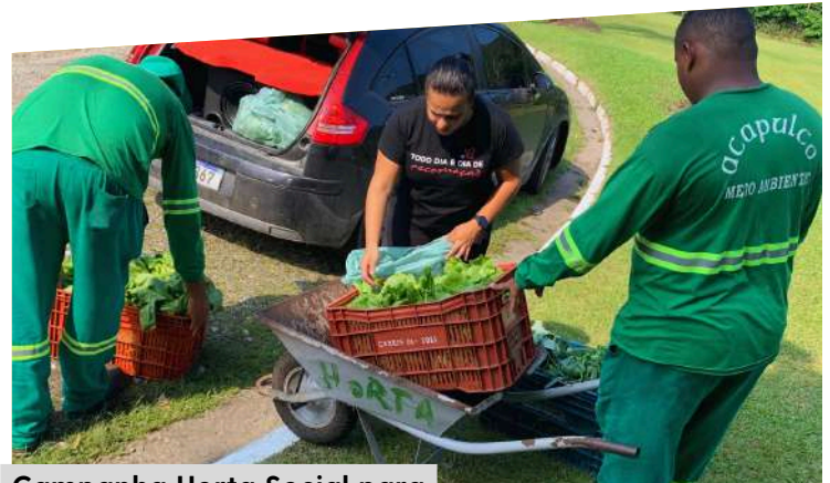
Campanha Horta Social para comunidades locais

A Gerência de Meio Ambiente tem como função principal a preservação e gestão dos aspectos ambientais do loteamento. Sempre incentivando as práticas sustentáveis, o cuidado com áreas verdes, o gerenciamento de resíduos, o controle de mosquitos da dengue, além de assegurar o cumprimento das regulamentações ambientais. Agora a Horta Social também está servindo de laboratório para o cultivo de plantas ornamentais que, mostrarem-se bem adaptadas às condições locais, podem ser replicadas nas avenidas e áreas verdes do loteamento.