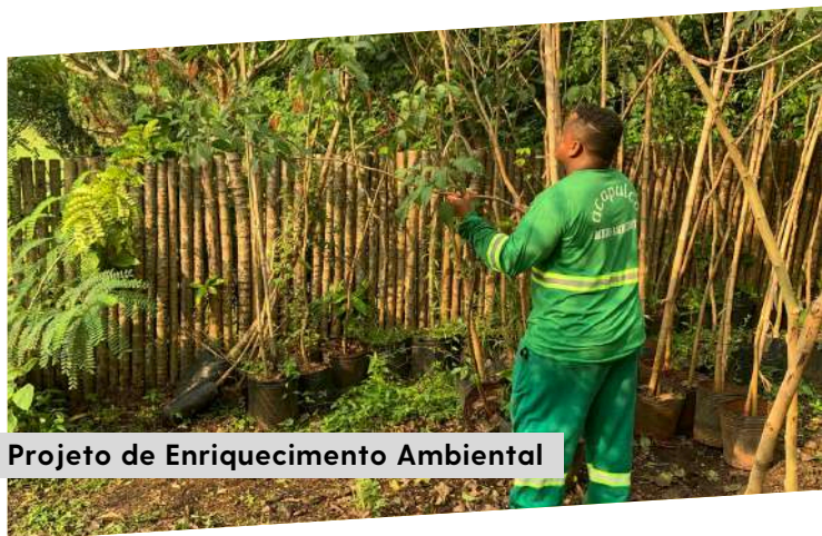
Projeto de Enriquecimento Ambiental